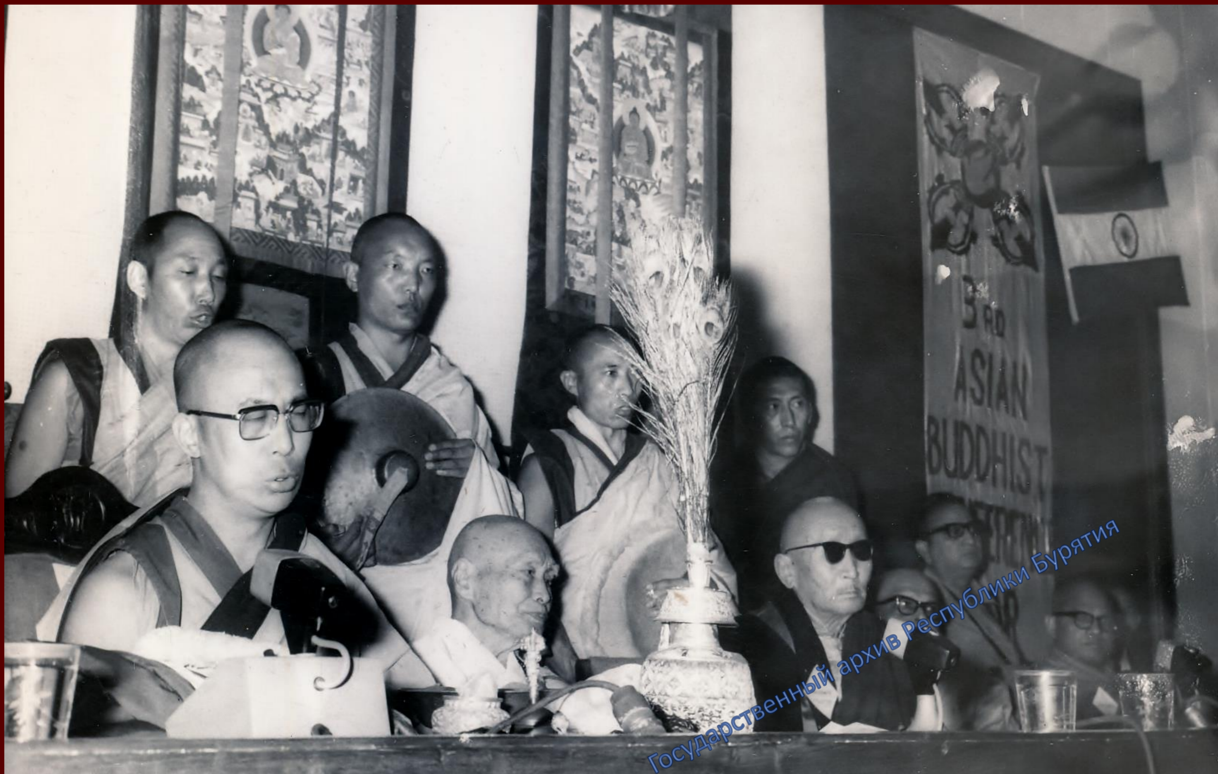
III Азиатская буддийская конференция за мир. Первый слева – XIV Далай лама, третий – XIX Пандито Хамбо лама Жамбал-Доржи Гомбоев. г. Улан-Батор. 1979 г.