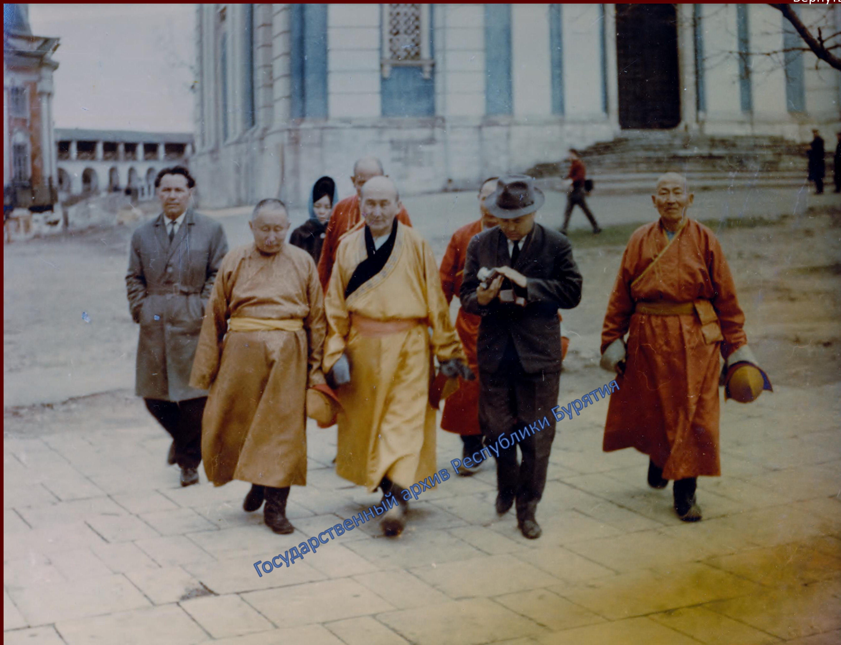
ХІХ Пандито Хамбо лама Жамбал-Доржи Гомбоев (2-й слева) с Хамбо ламой Монголии Гомбожавом (3-й слева). [1970-е гг.]