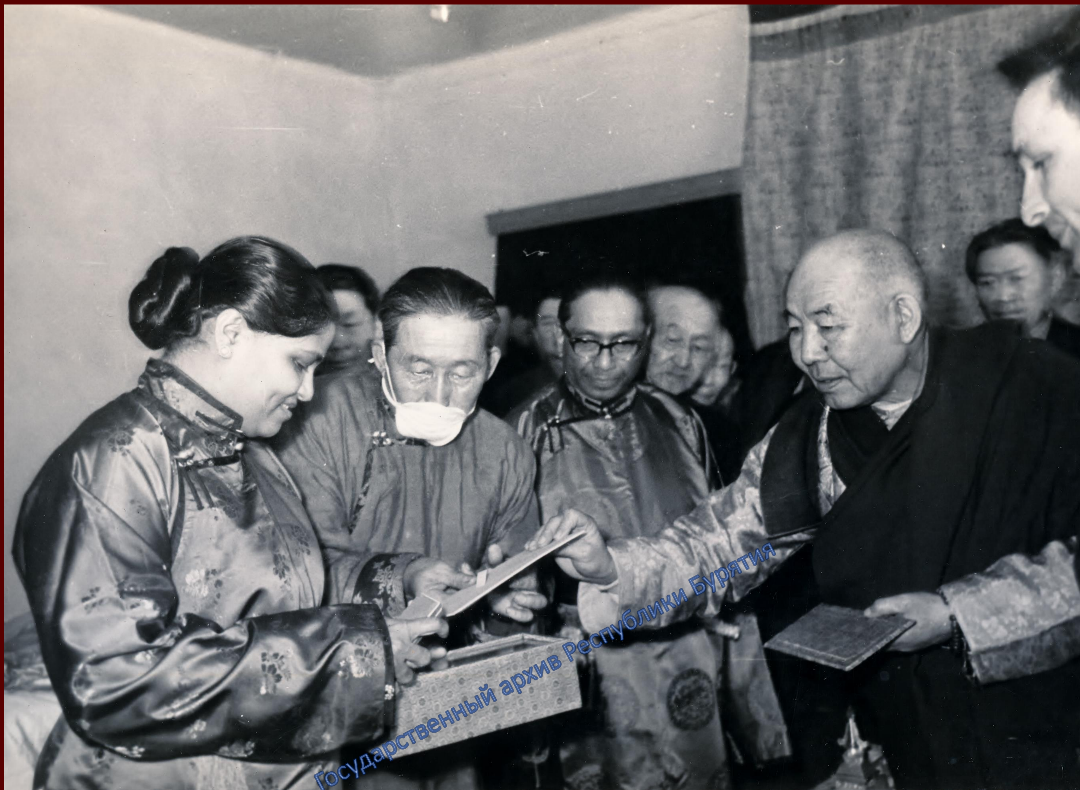
XVIII Пандито Хамбо лама Еши-Доржи Шарапов (справа) встречает индийских ученых. [1950-е гг.]