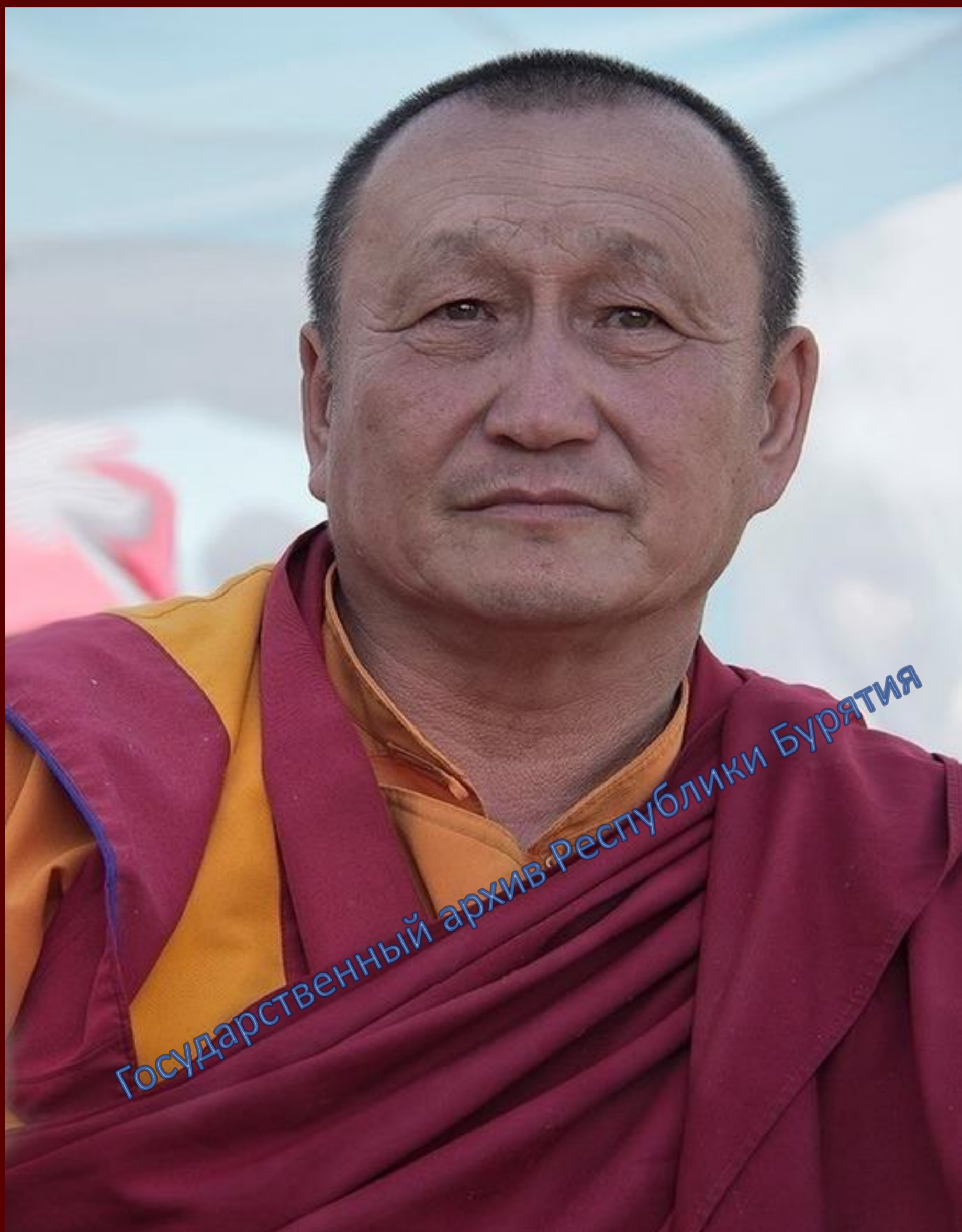
XXIV Пандито Хамбо лама Дамба Аюшеев.

Родился 1 сентября 1962 г., с. Шергольджин Красночико́йского района Читинской области. В 1980 году окончил Петровск-Забайкальское педагогическое училище. В 1983 году поступил в Буддийский университет им. Дзанабадзара в г. Улан-Баторе, окончил в 1988 г., работал эмчи-ламой в Иволгинском дацане.