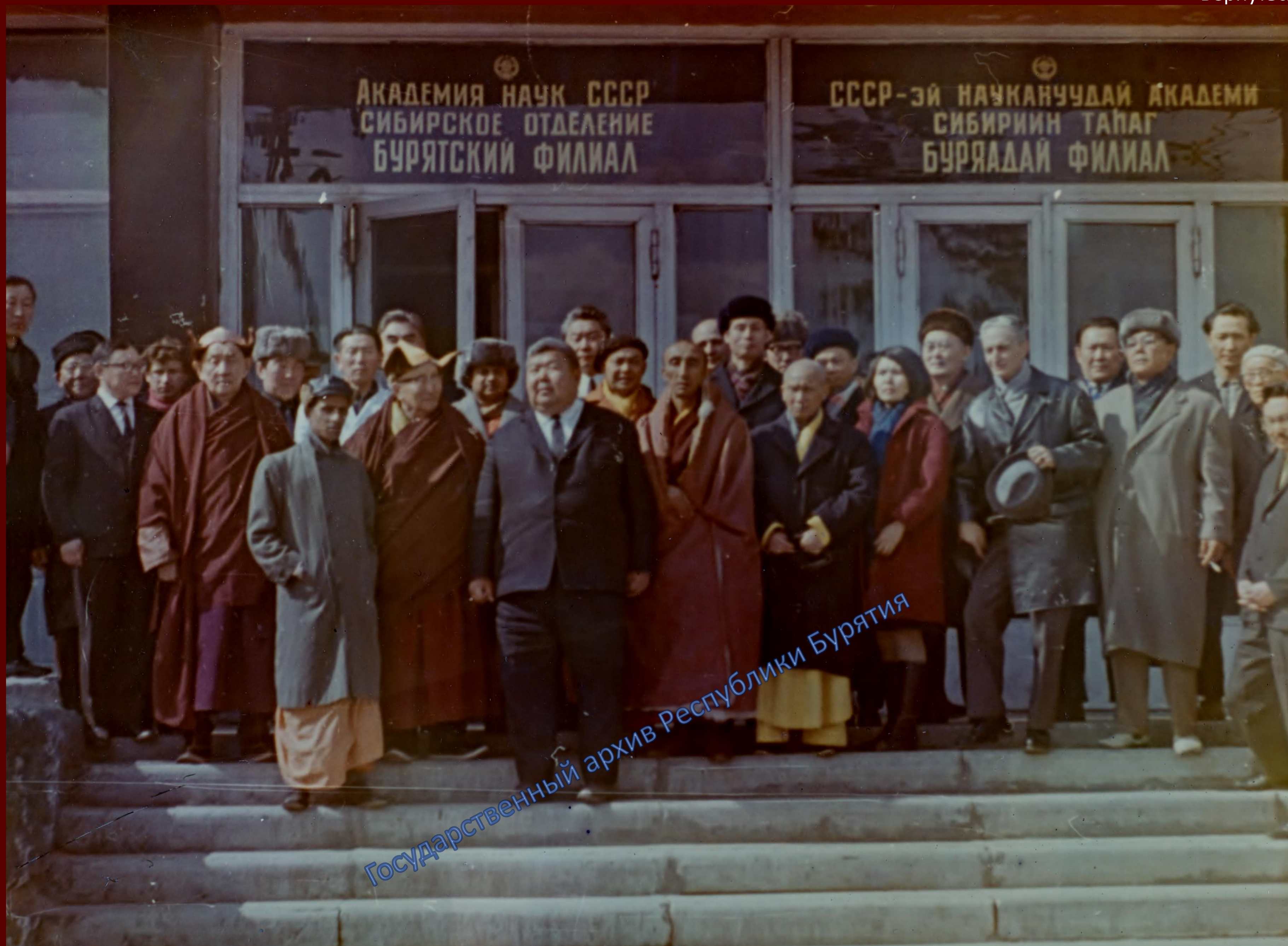
Приезд Бакула Ринпоче (в центре) в Бурятию. 4-й слева - XIX Пандито Хамбо лама Жамбал-Доржи Гомбоев, 5-й председатель Президиума Бурятского филиала СО АН СССР В.Р. Филиппов, 6-й – Бакула Ринпоче. 1968 г.