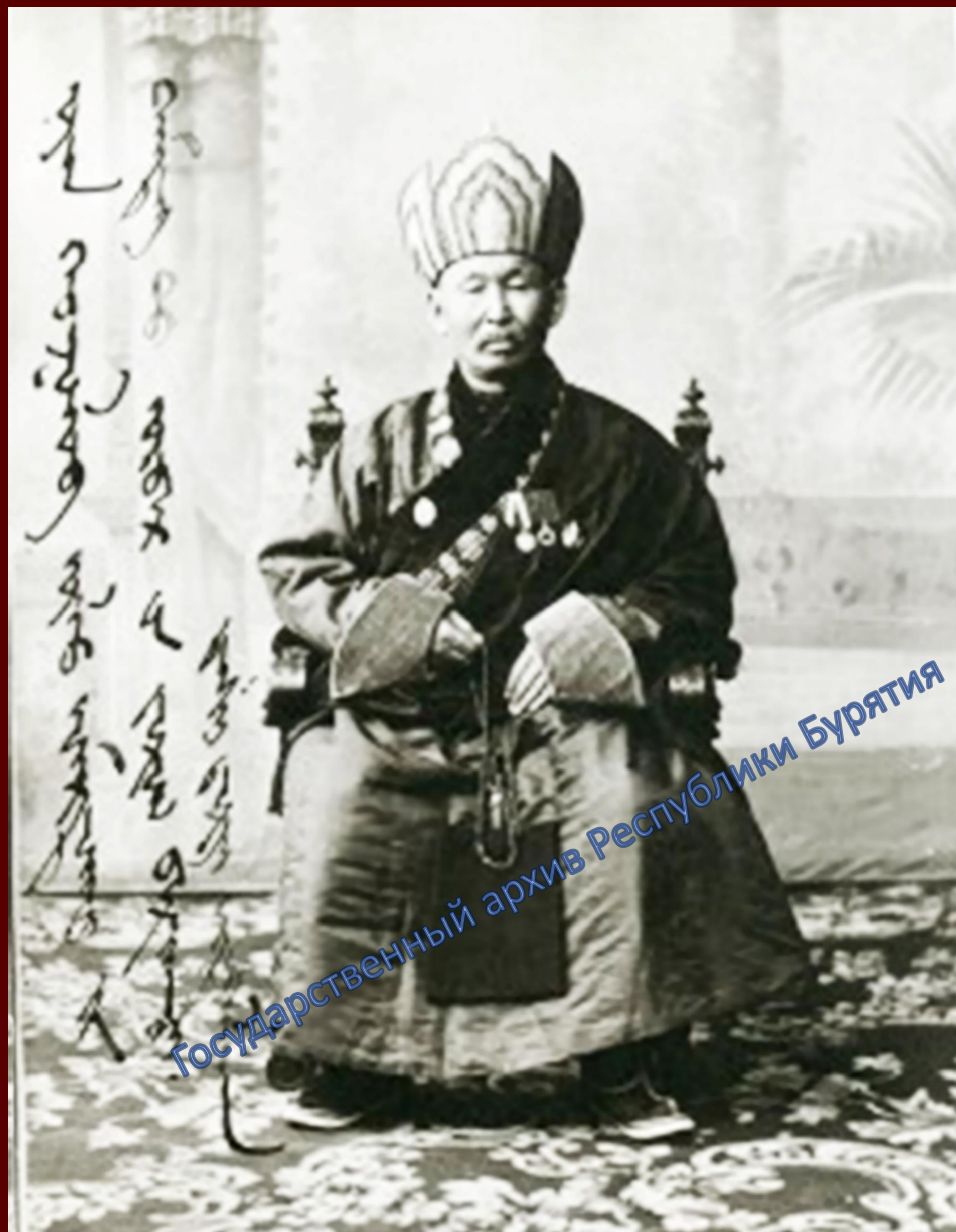
ХII Пандито Хамбо лама Даши-Доржо Итигэлов. г. Санкт-Петербург, 1913 г.

Даша Доржо Итигэлов родился в 1852 г. в местности Улзын Добо с. Оронгой в семье Мунко-Тагара Этигэлова из рода готол-буумал. Учился в Анинском дацане. После - продолжал учебу и практику в Агинском и Цугольском дацанах.