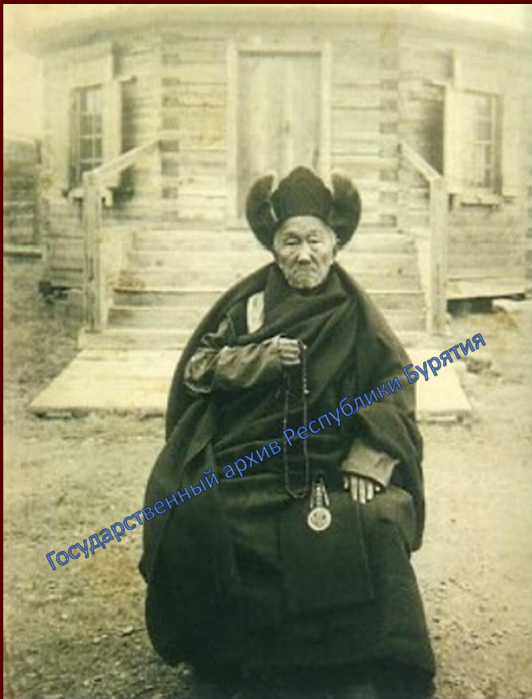
XV Пандито Хамбо лама Цыгунжап Баниев.