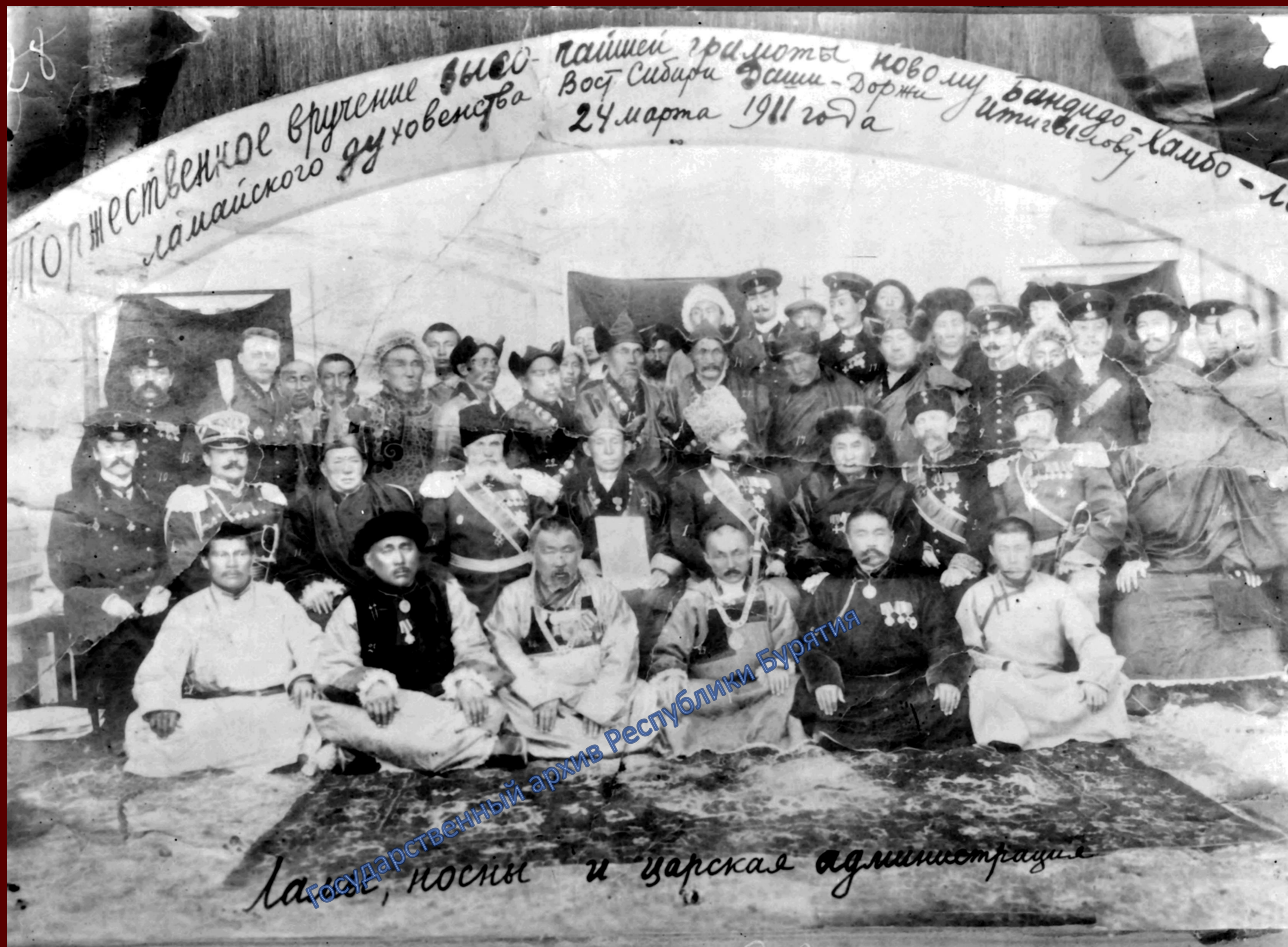
Торжественное вручение высочайшей грамоты новому Пандито Хамбо ламе Восточной Сибири Д.-Д. Итигэлову. 24 марта 1911 г.