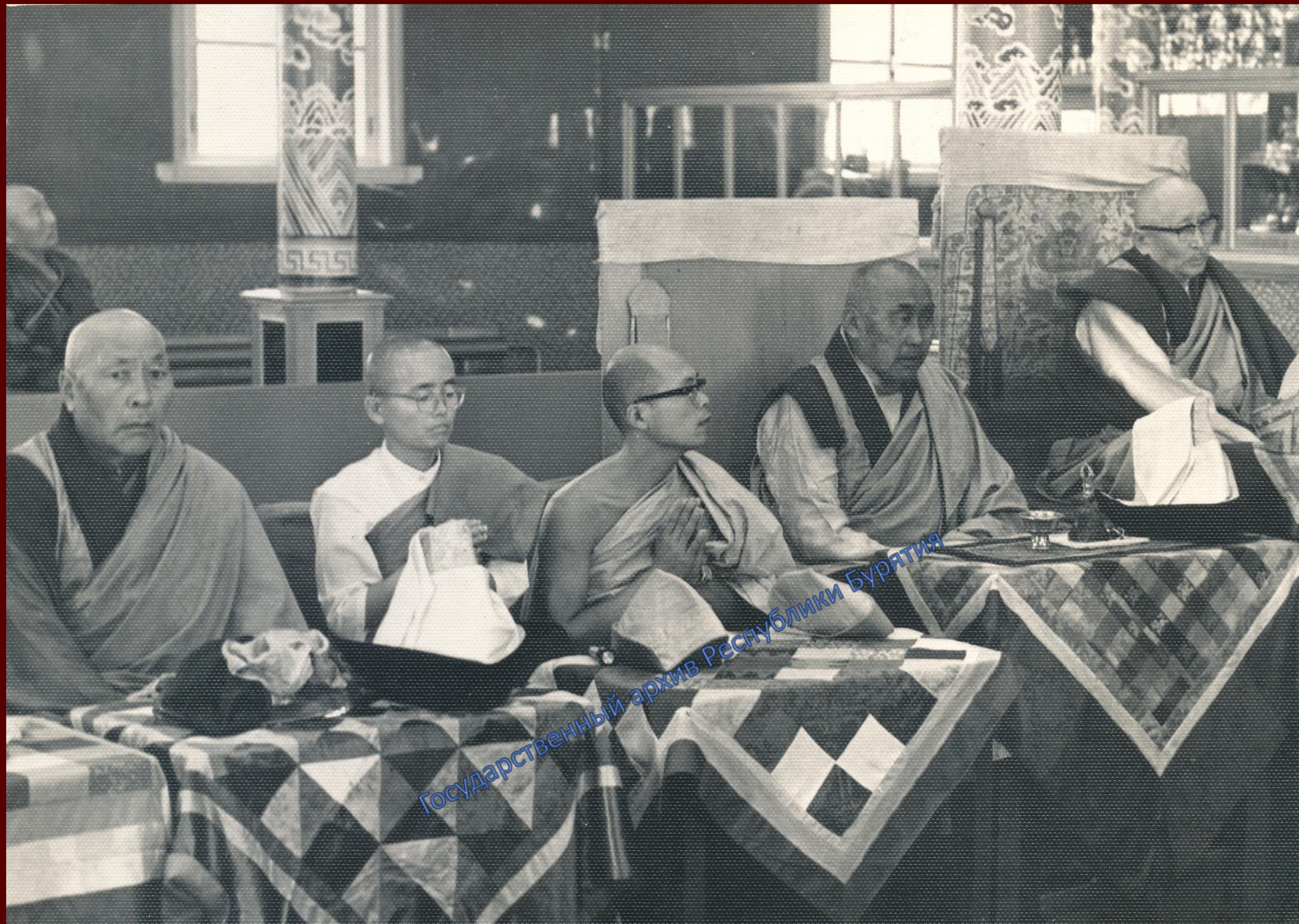
Молебен. Без даты.