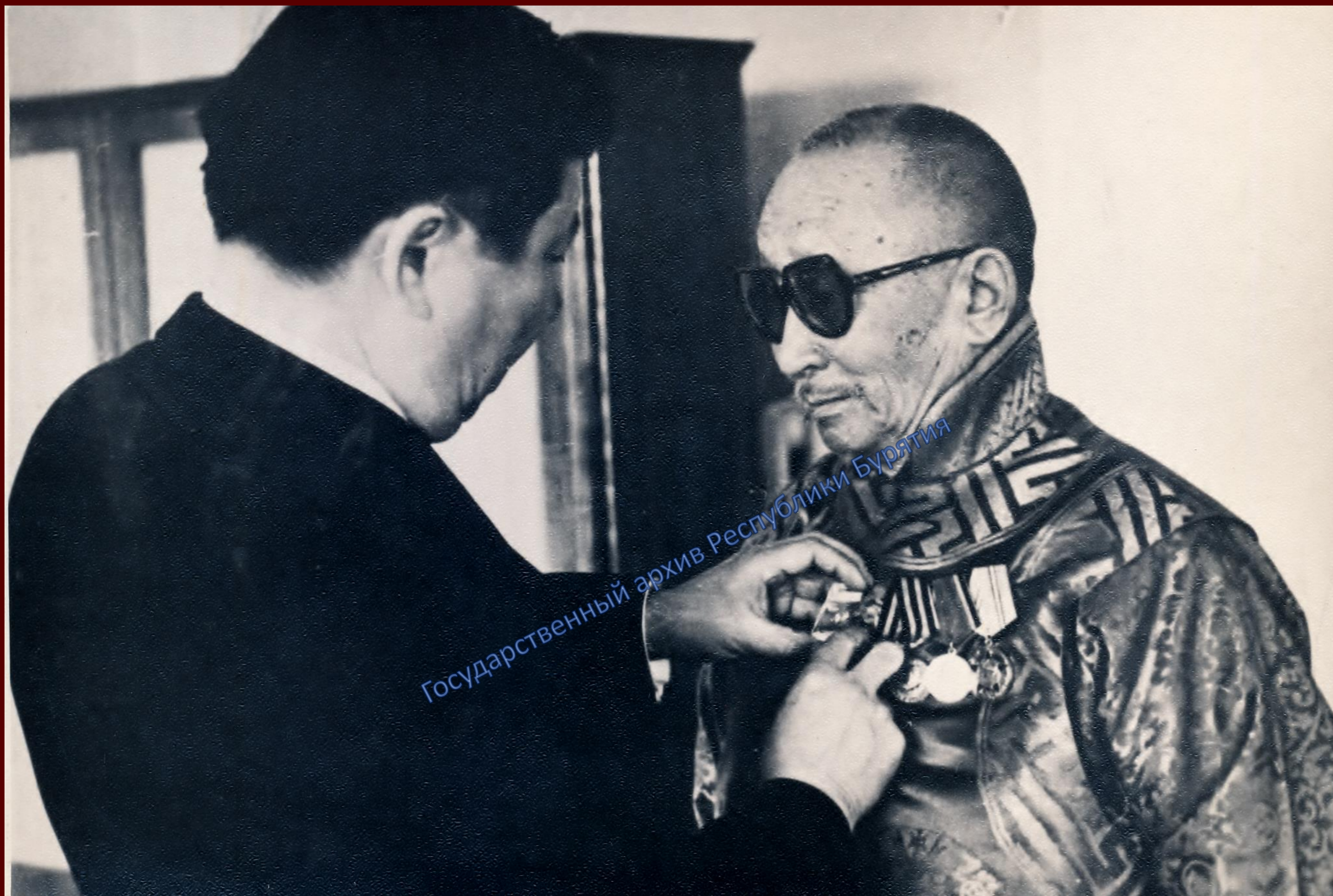
Председатель Президиума Верховного Совета Бурятской АССР Бато Семенов вручает орден «Знак Почета» XIX Пандито Хамбо ламе Жамбал-Доржи Гомбоеву. [1970-е гг.]