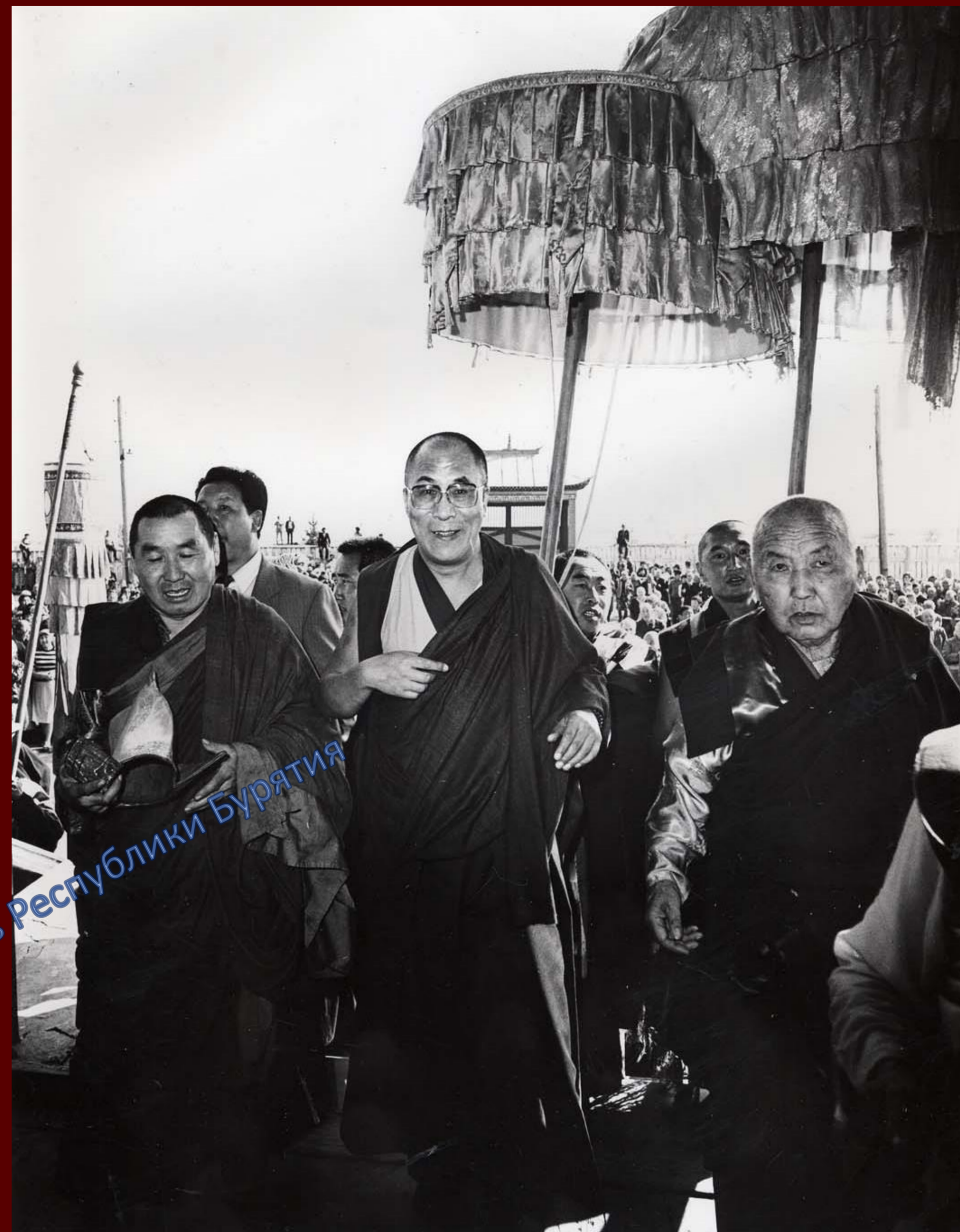
Приезд Далай-ламы в Бурятию. XIV Далай-лама (в центре) и XX Пандито Хамбо лама Жимба-Жамсо Эрдынеев. 1987 г.