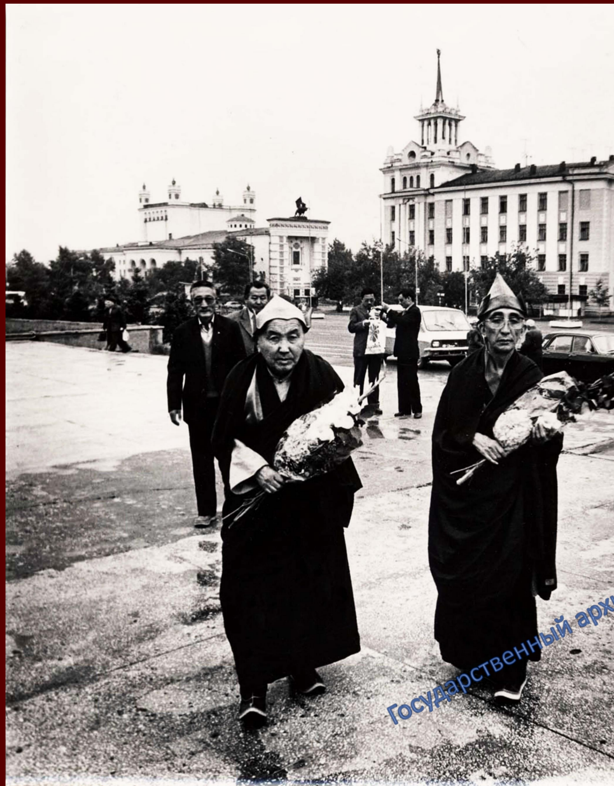
Посол Индии в Монголии Бакула Ринпоче (справа) и XX Пандито Хамбо лама Жимба-Жамсо Эрдынеев на площади Советов г. Улан-Удэ. 1987 г.